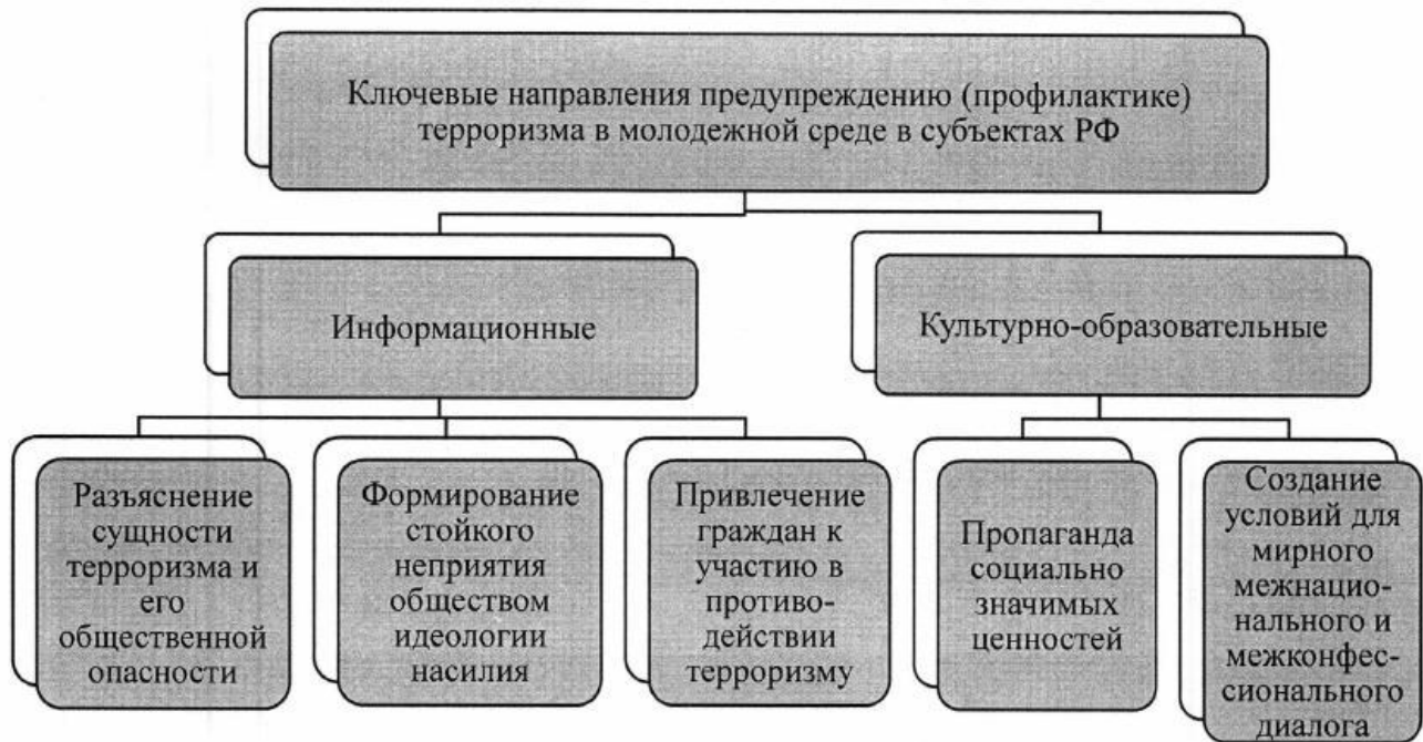
Рисунок 1. Ключевые направления предупреждению (профилактике) терроризма

Перечисленные выше направления реализации Комплексного плана предполагают следующие форматы проведения мероприятий: